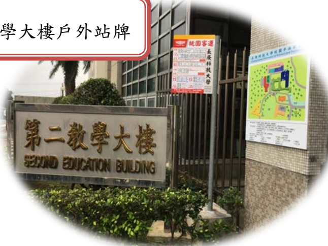
第二教學大樓戶外站牌