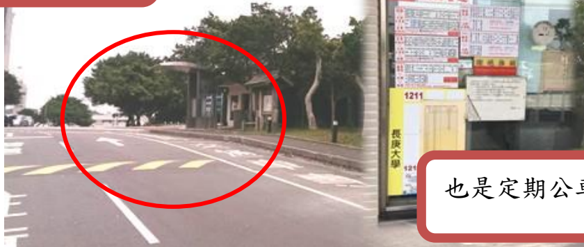
也是定期公車候車處