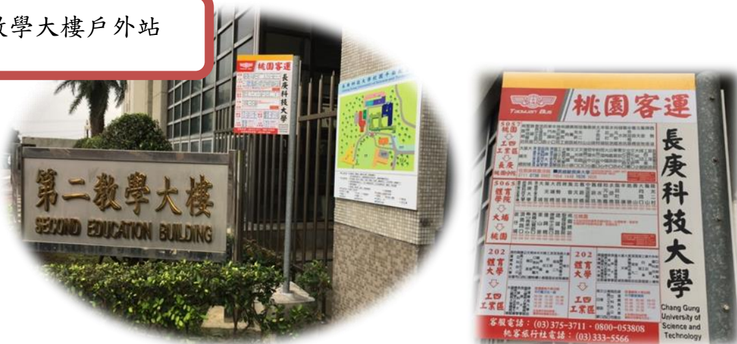
第二教學大樓戶外站